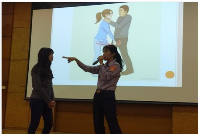
如何攻擊歹徒的弱點