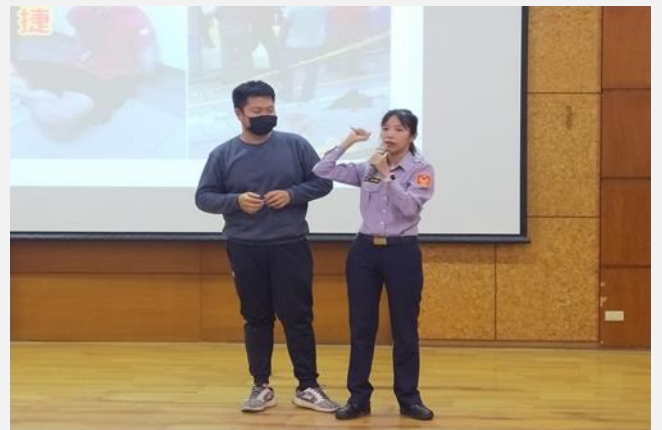
利用隨身物品(如:雨傘、鑰匙、原子筆)自我防護