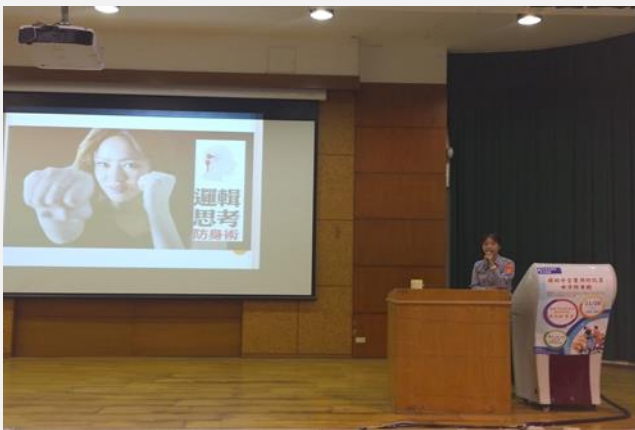
遇到危險時應保持冷靜