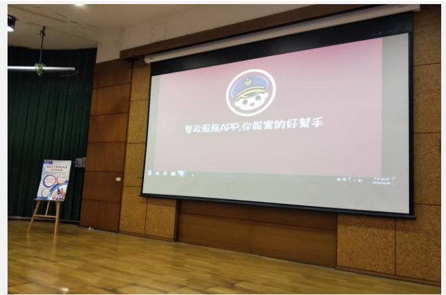
下載「警政服務 APP 你報案的好幫手」