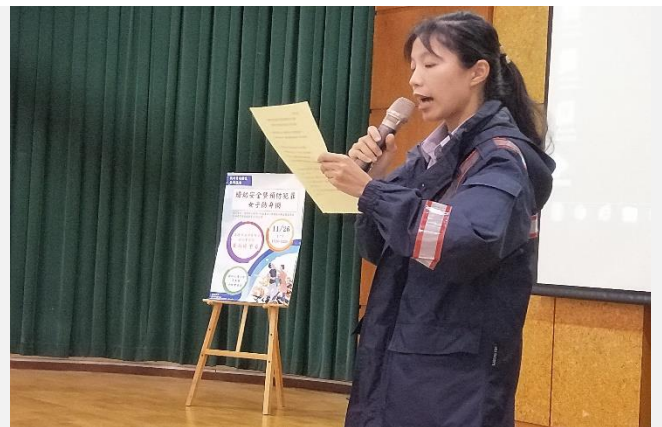
講座結束後再遊講師一一解答說明(課後)