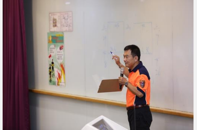
火災當下辨別該往上還是往下跑