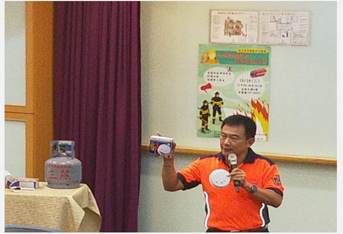
講師分享居家消防診斷表及住警器的重要性