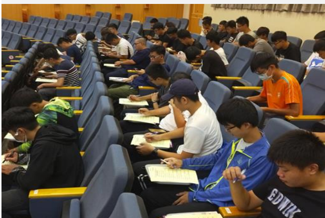
提供課程內容是非題自我檢測(課前)