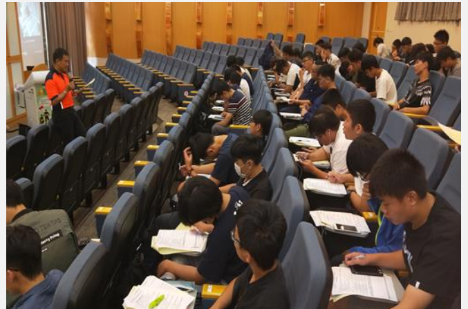
課後自我測驗一次再請講師講解(課後)