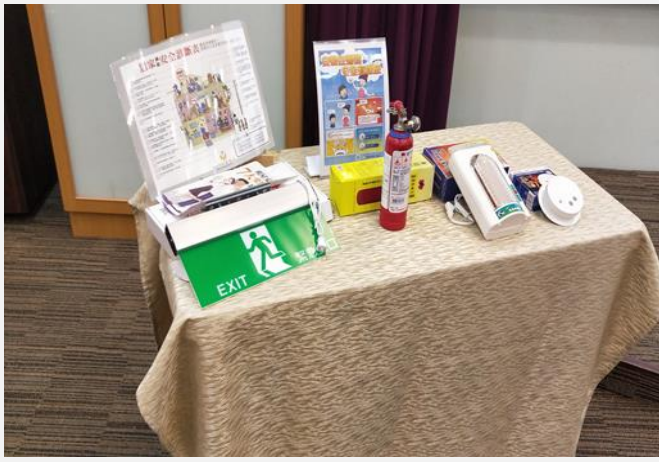
現場展示各項消防設備及宣導文宣