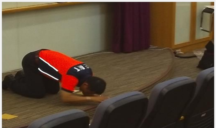
火場中如何降低濃煙吸入