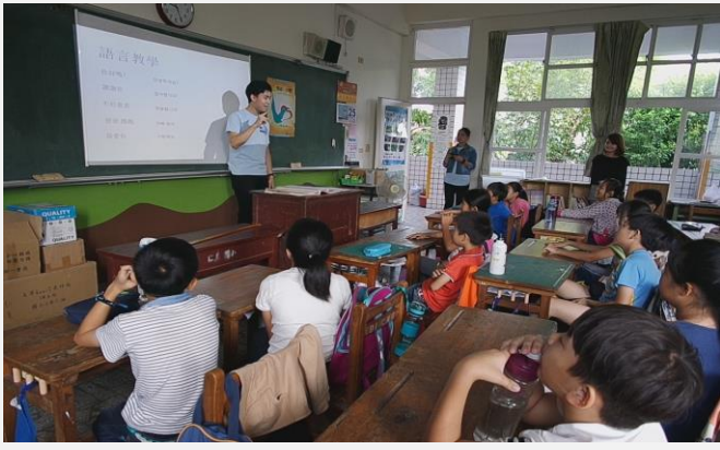
韓國境外學生-文化分享