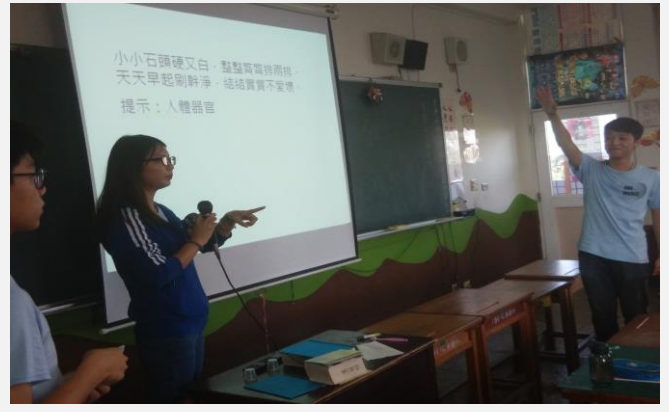
浙江境外學生-文化分享