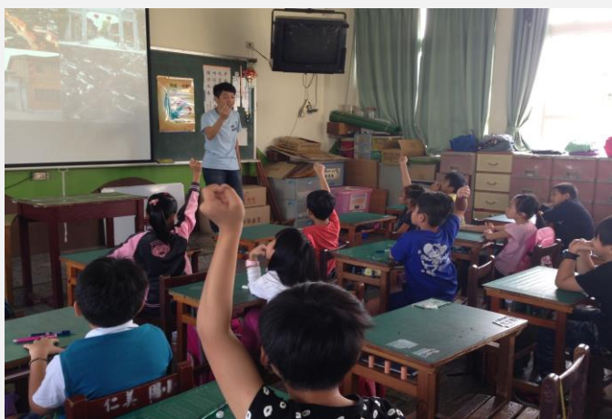
福建境外學生-文化分享

本次對象以中年級生為主(3-4 年級，服務學生約 100 人)，結合仁美國小語文與課外活動課程，並配合教育部國際特色小學之發展計畫，到學校教授小朋友們不同國家的文化與地方特色，散撥多元文化之美，教學內容包含自我介紹及計畫介紹與開場、外國語言學習、多媒體簡報(簡報含各國簡易外語教學與特色文化及景點介紹)與外國料理實作：福建糰粿與韓國泡菜。每個境外生都有主場，主任特意安排一個境外生負責一班，讓一個班級的學生充分體認其中一國的獨特文化，休息時間還帶學生參觀校內蝴蝶自然保育園區，很幸運看到稀有種的黃裳鳳蝶的出現，及他們的卵和蛹。實作的課程也讓國小老師們讚嘆不已，非常期待再一次的合作機會。