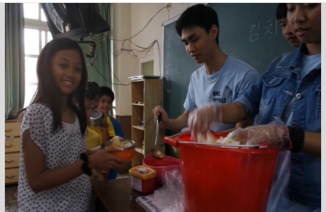
當地美食：韓國泡菜製作(二)