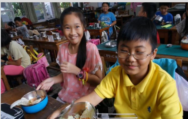
當地美食：韓國泡菜製作(一)