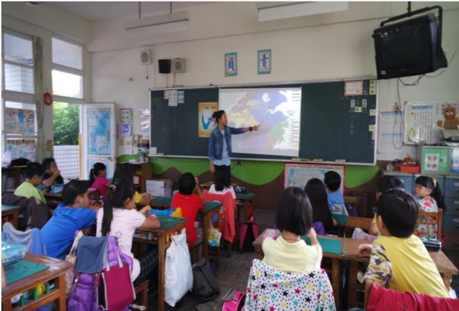
浙江境外學生-文化分享