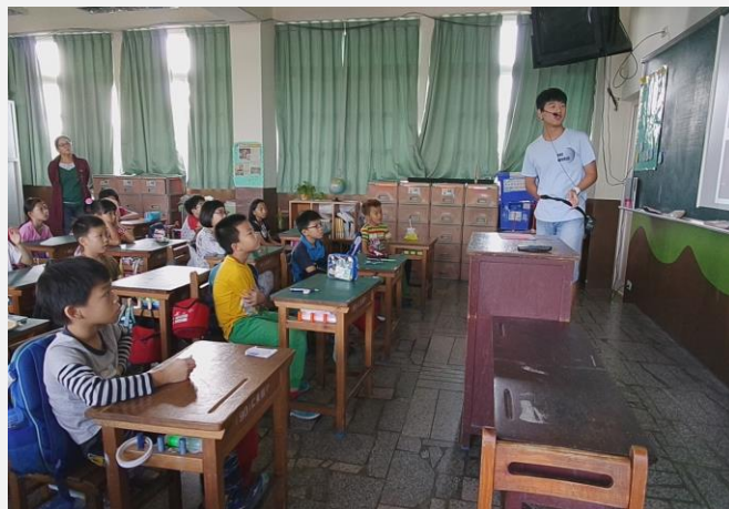
福建境外學生-文化分享