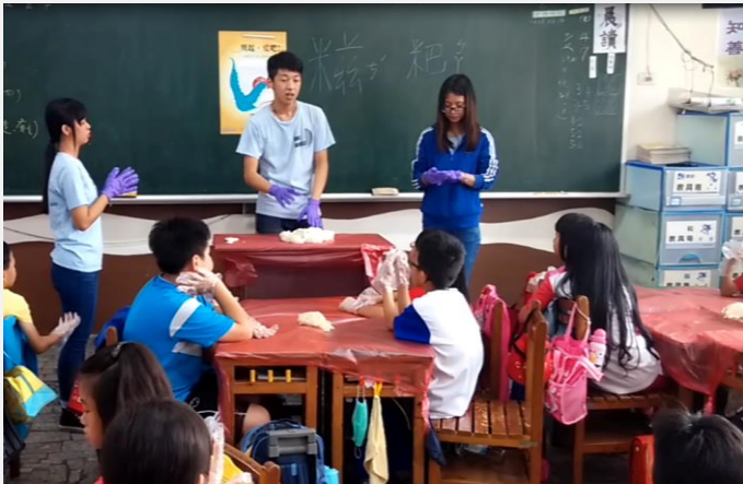
當地美食：福建糍粑製作(一)