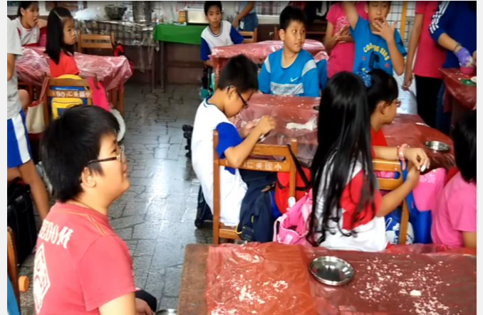
當地美食：福建糍粑製作(二)