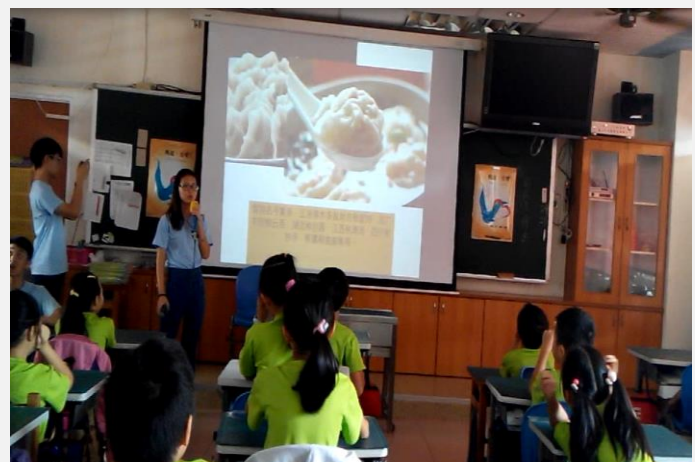
浙江境外學生-文化分享