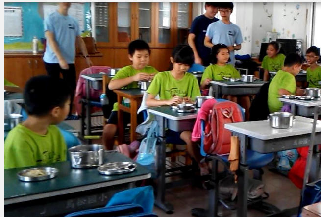
當地美食：享用浙江雜糧煎餅