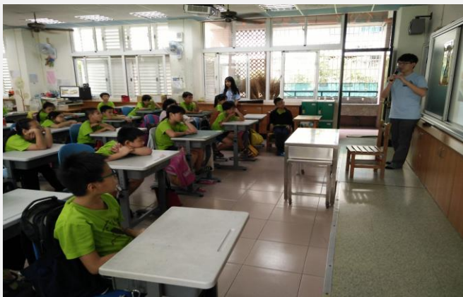
馬來西亞境外學生-文化分享