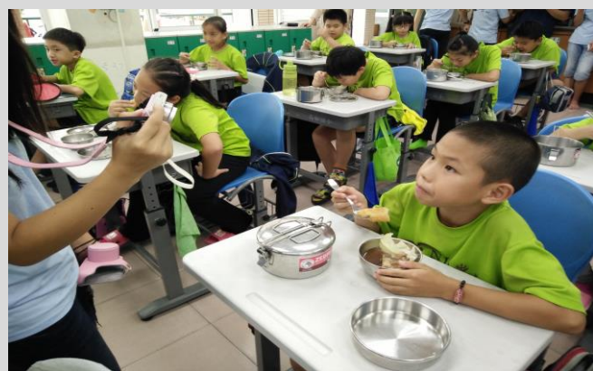
當地美食：享用馬來西亞肉骨茶