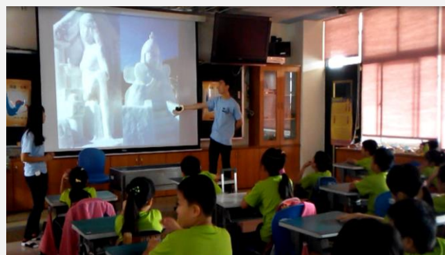
韓國境外學生-文化分享