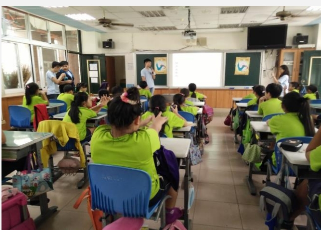
福建境外學生-文化分享