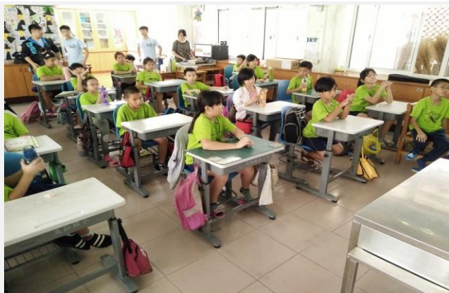
認真聽講的國小學生