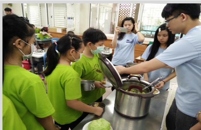
當地美食：馬來西亞肉骨茶製作