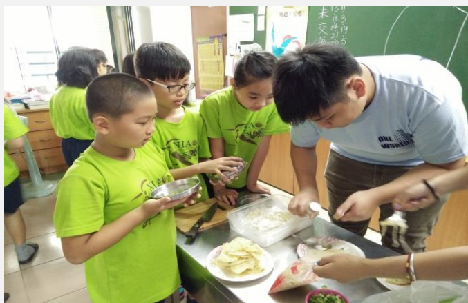
當地美食：浙江雜糧煎餅製作