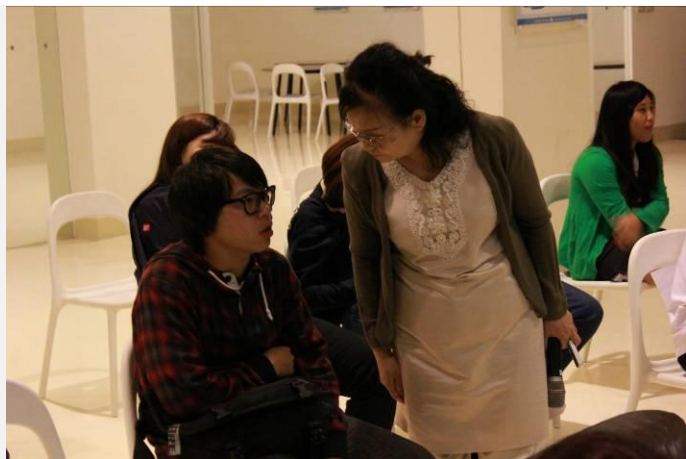
學生提出他的看法(三)