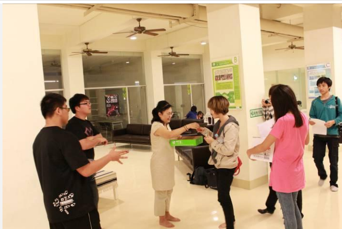
活動結束老師發結緣品(二)自治幹部收回饋單