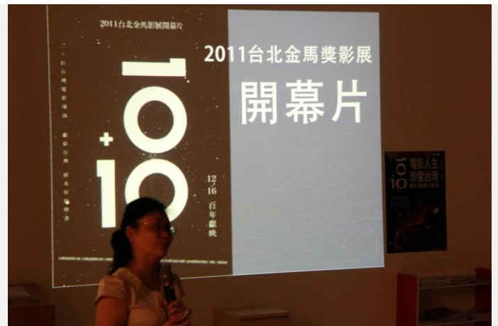
<10+10> 為 100 年金馬獎影展開幕片