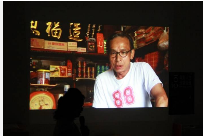
影片幕後花絮〈有家小店叫永久〉