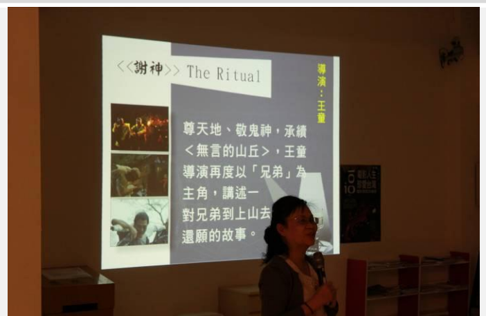
播放前先介紹接下來要看的影片