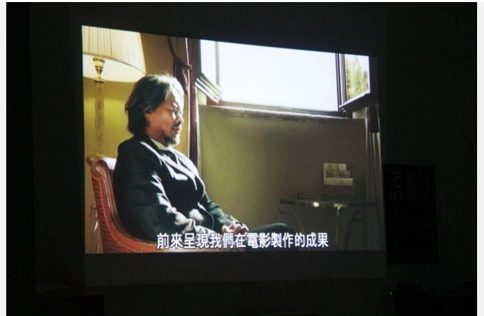
影片幕後花絮〈登場〉