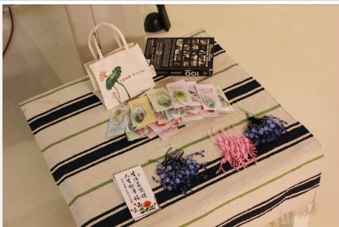
老師為今日所準備的結緣品有3種