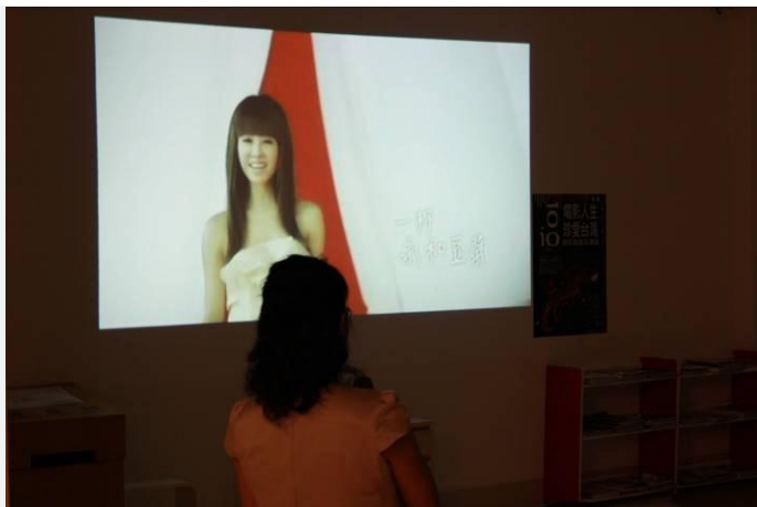
最後老師以「臺灣的心跳」這首歌做結尾