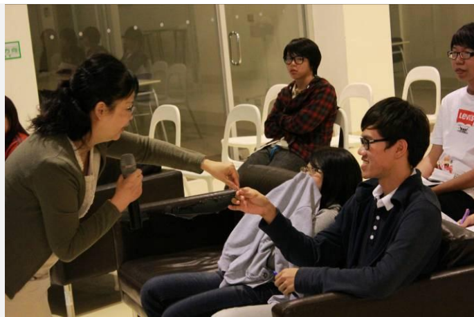
老師以限量結緣品獎勵發言的同學