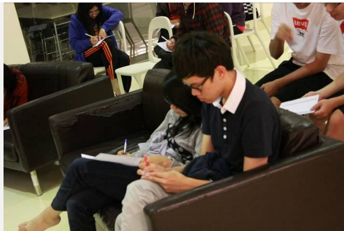
學生現場寫下對於活動的感動與體驗