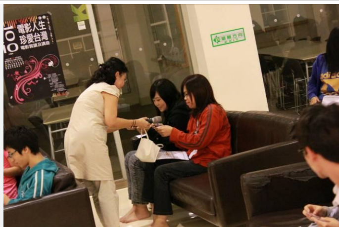
老師現場發結緣品(一)