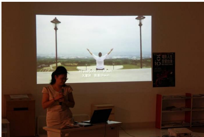
老師以一部〈我愛台灣〉短片開場