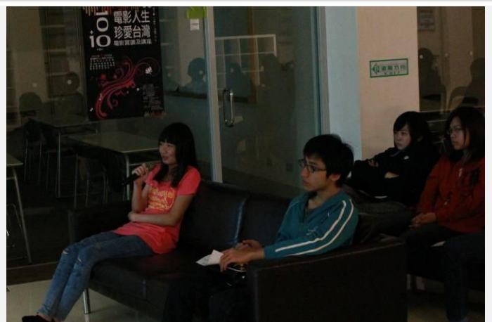
學生提出看完後分享最令他印象深刻的事