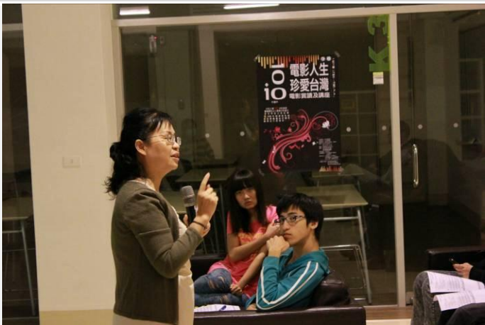
老師引導同學提出他的看法