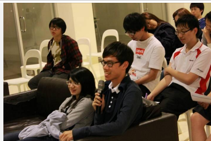
學生提出他的看法(一)