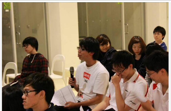
學生提出他的看法(二)