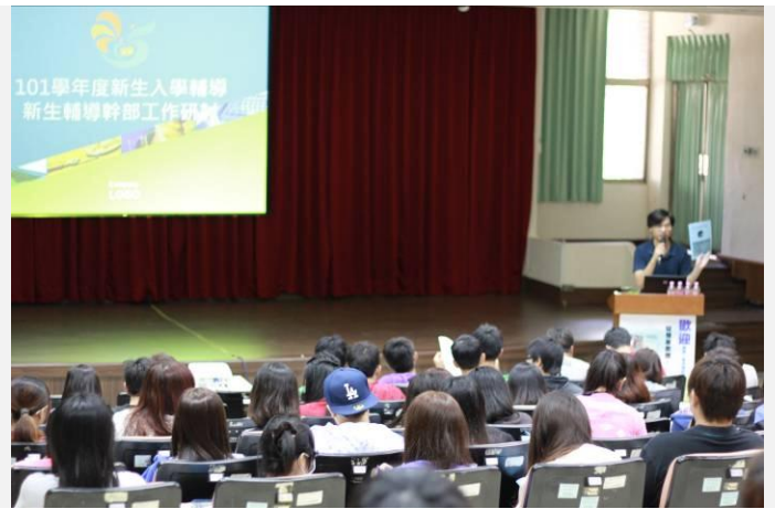
活動承辦人講解新生入學輔導當天活動流程