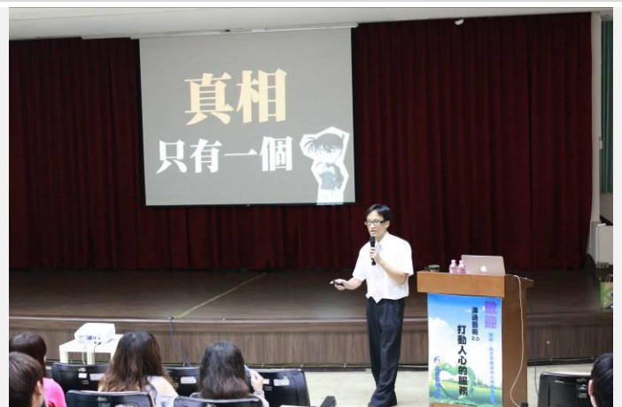
林老師以犀利的方式點出問題的癥結點