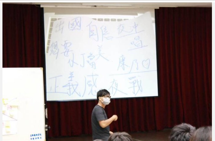
討論後推派代表後上台演練(二)