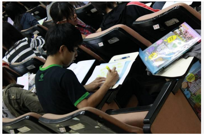
種子學生現場演練情況(二)