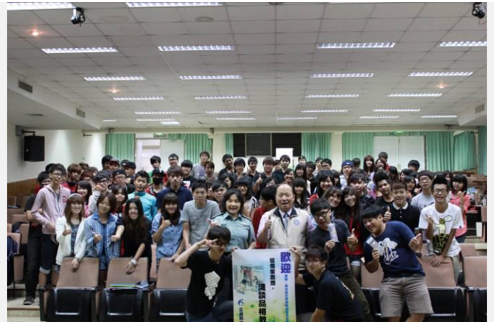
講座結束拍大合照