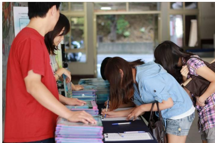
各系系會長及輔導員現場簽到領取會議資料