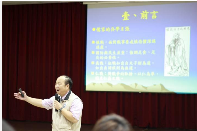
邀請蔣將軍現場分享品格教育的重要性