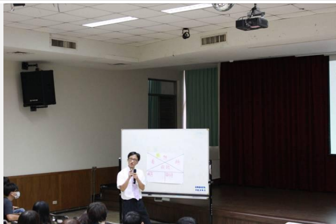
老師以「同理心地圖」引導種子學生思考