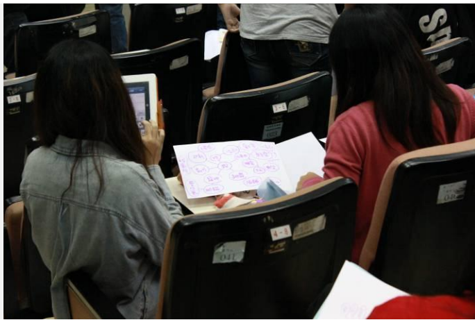
種子學生現場演練情況(一)