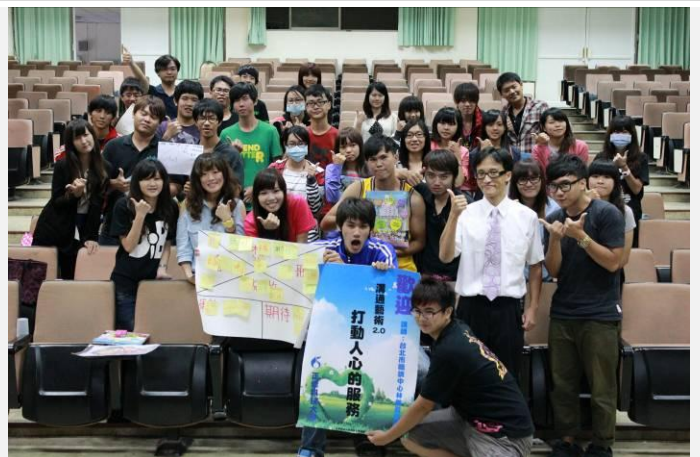
講座結束拍大合照