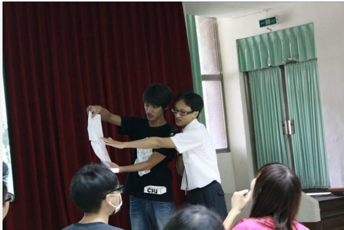
老師指導學生情形