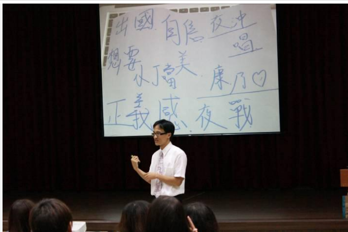
最後導師對上台演練的學生一一講評