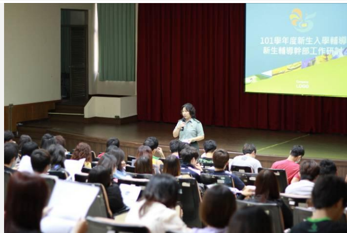
由生輔組長主持開場