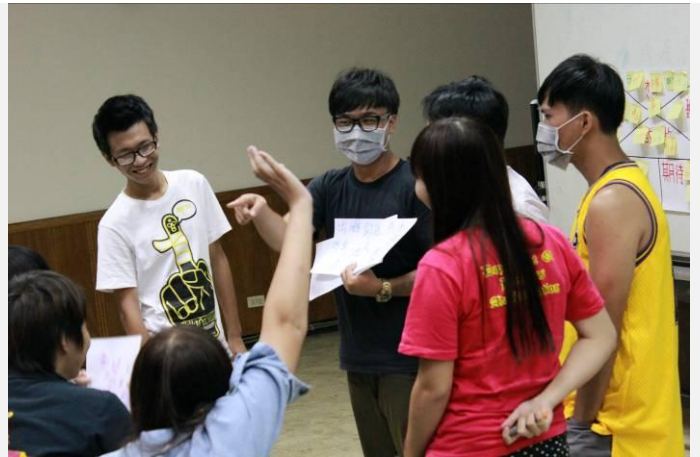
種子學生分組討論演練