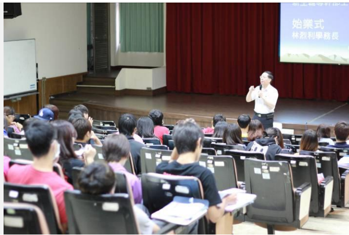
始業式由林學務長現場勉勵輔導員