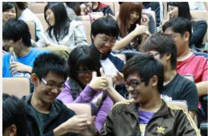
韓老師以 的小遊戲讓同學體驗”心”品德