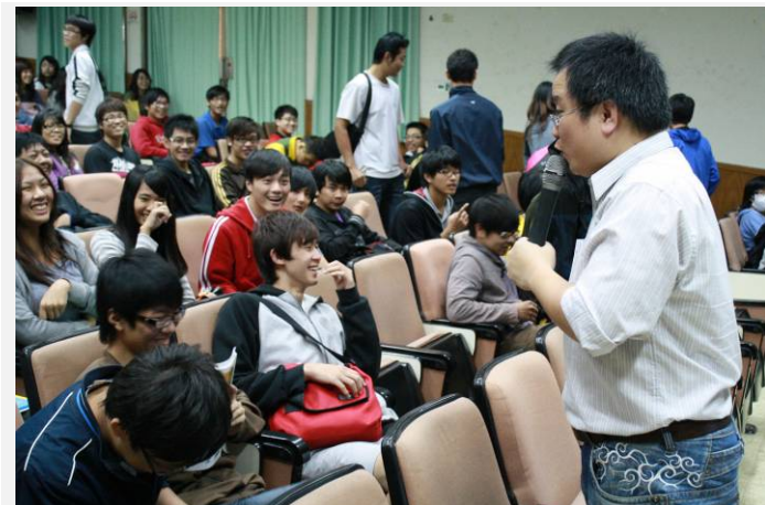
韓老師演講時活 同學