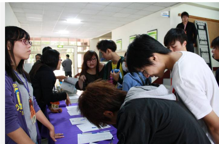
學生 到 場