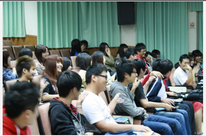
韓老師： 你 的人說聲「 ~」