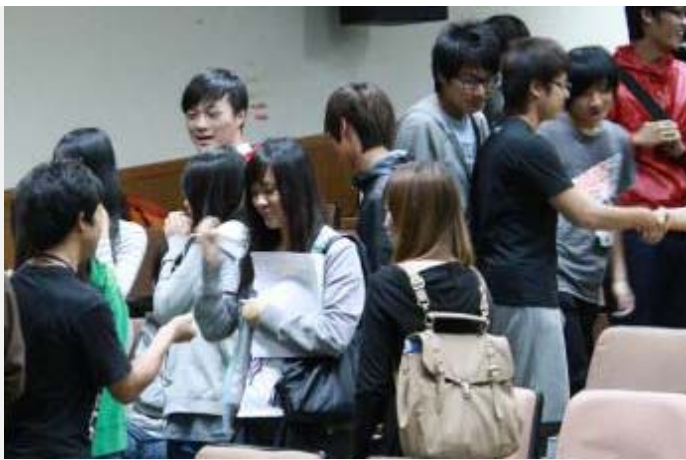
韓老師以 的小遊戲讓同學體驗”心”品德