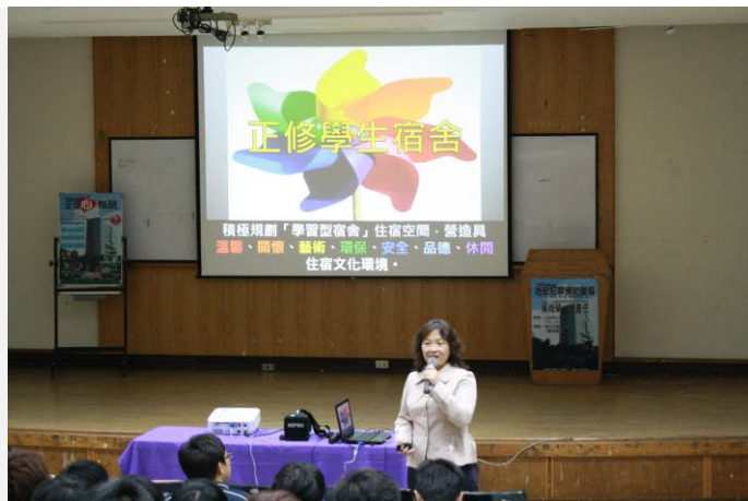
生輔林組長說明校方 要營造的住宿文化