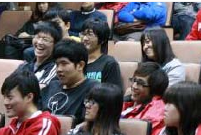
韓老師以 的 得全場笑聲不