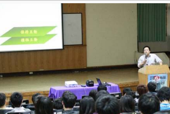
學生 的重點「 主動」、「保持互動」