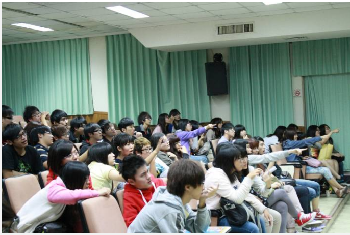
老師 出一個 題，引發同學 討論