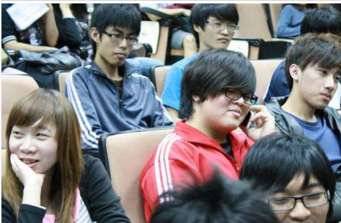
同學打電話回家跟家人說「我愛你」