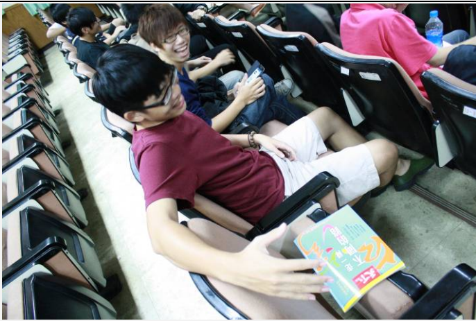
韓老師： 你 的人說聲「 ~」