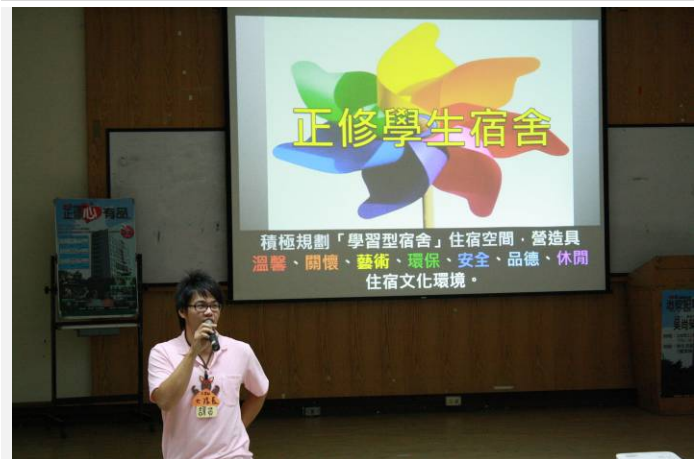
大隊長 自我 (宿舍自治)