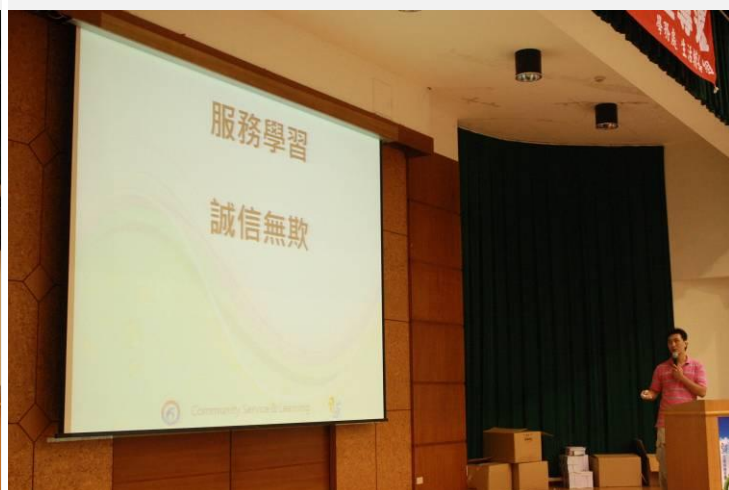
陳老師講解服務學習課程的核心精神