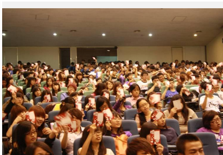
同學拿起感恩卡響應「正修拉芙節」活動