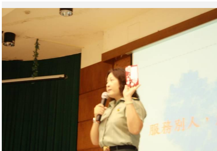
生輔組長宣導在服務學習中必需學習感恩的心