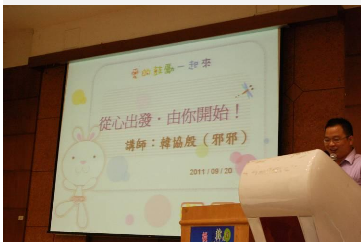
韓老師上課前先講解「互動」的重要性