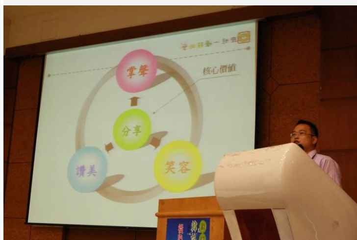
老師講解「服務學習的核心項目」