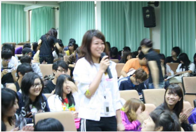
同學回覆何謂中台四箴行