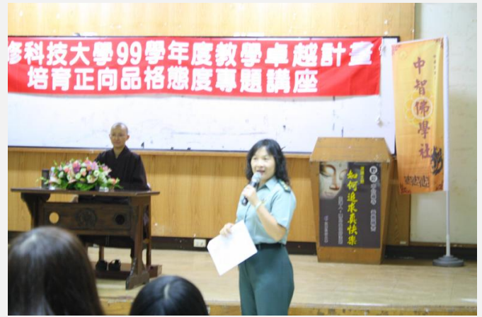
會後生輔組組長感謝住持蒞校分享