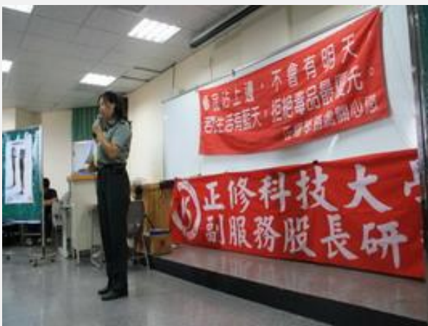
副服務股長研習-諸教官請幹部宣導春暉反毒活動