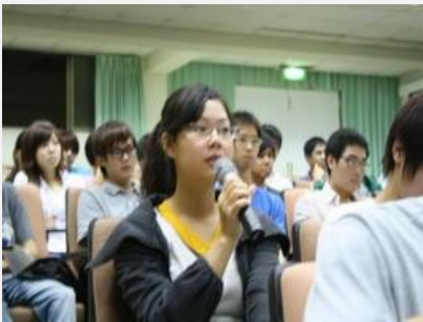
台上台下互動零距離