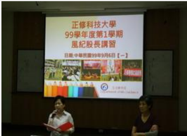
生輔組針對與同學生活息息相關的缺曠請假問題 提供講解與回覆