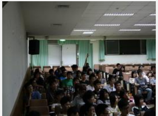
研習會場同學發問