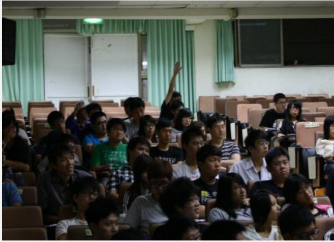
演講過程學生反應熱烈