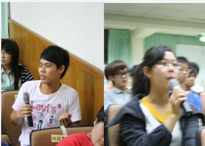
風紀股長對於業務不懂的地方提出疑問