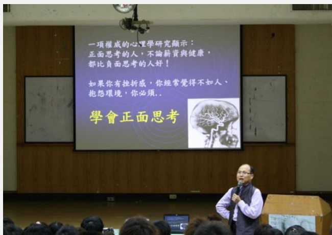
王老師講解正向思考的優點