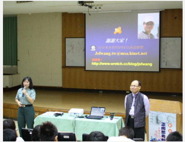
演講結束生輔組組長感謝老師的演講