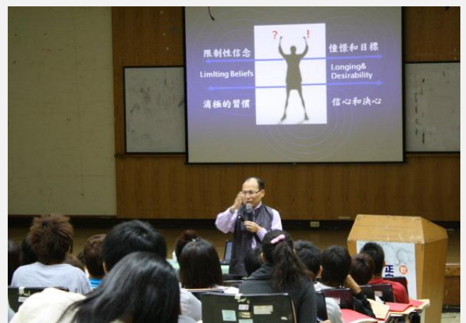
王老師勉勵同學正向思考