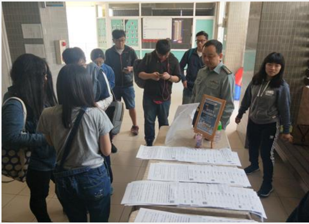
賃居股長加入群組宣達校外賃居業務