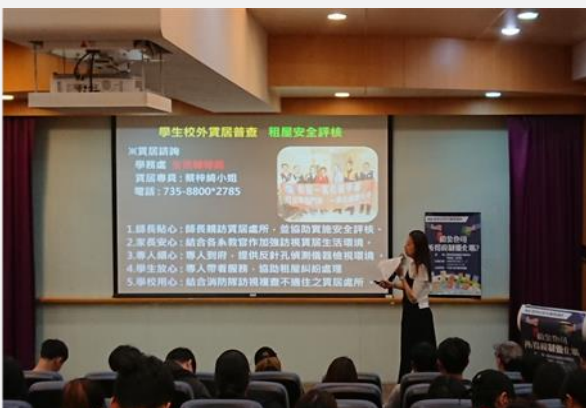
賃居專員宣達本校賃居服務業務