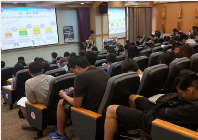
單身授薪階級低於 40.8 萬者免繳納所稅