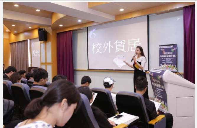
結束後協請學生填寫滿意度調查問卷