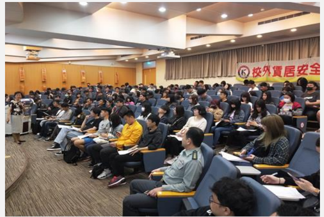
打工及房屋租金可列入扣抵稅