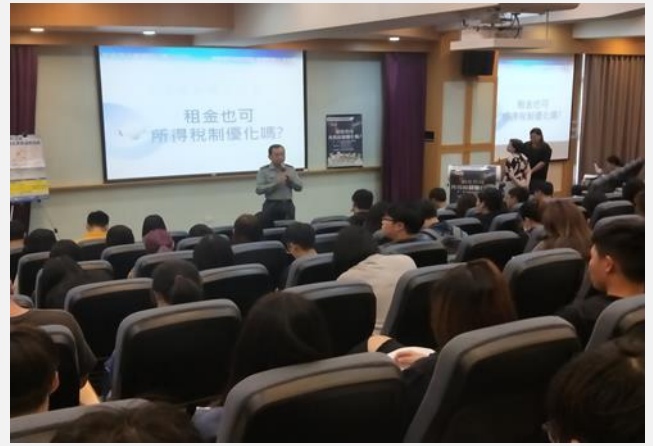
生輔組長利用校方案例提醒學生報稅的重要性