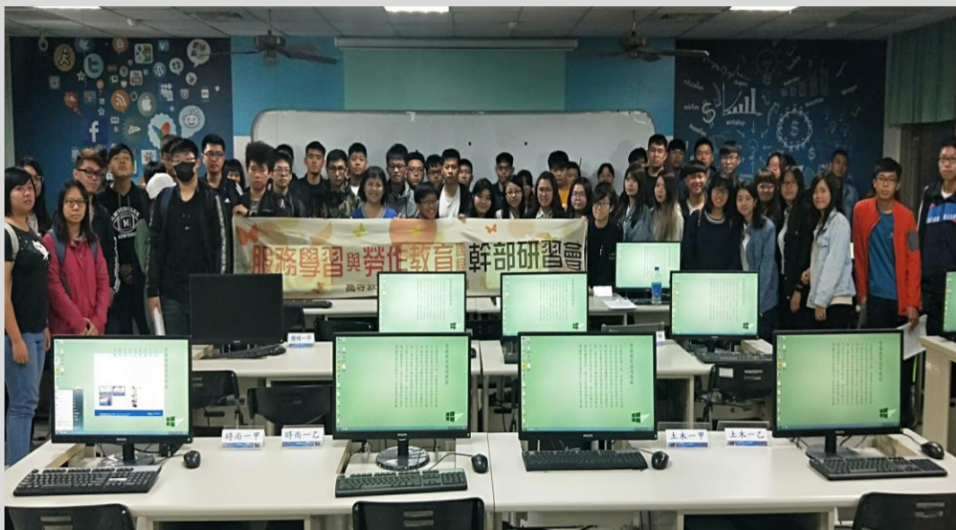
幹部課程研習會議全體合影