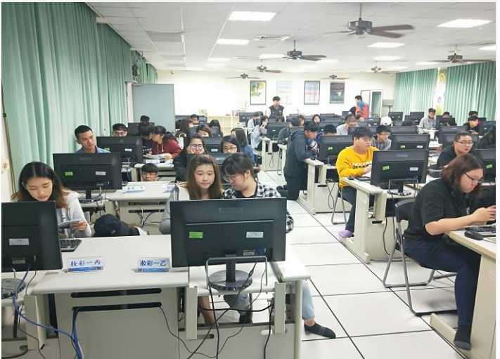
幹部研習會現場實況與電腦操作(二)