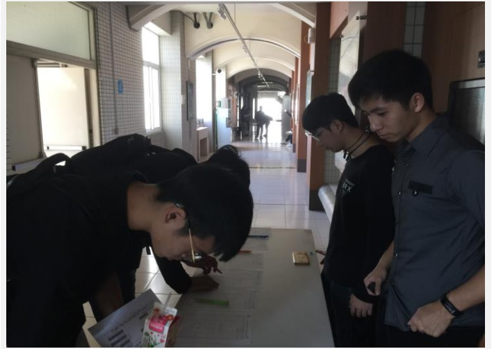
各班課程施做股長簽到之情形(二)