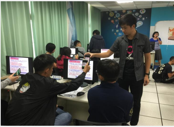
新幹部加入課程討論群組