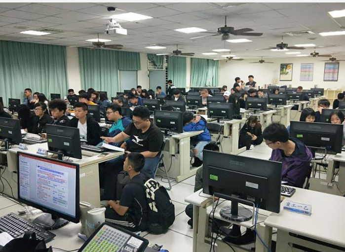
幹部研習會現場實況與電腦操作(一)