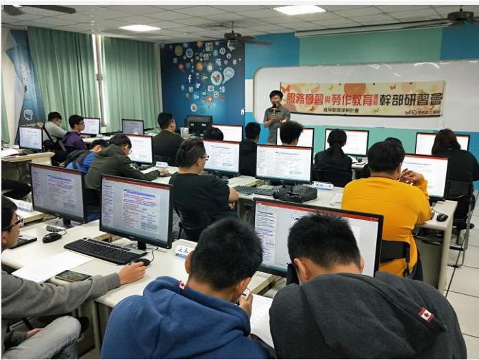
承辦人員向各幹部說明服務學習課程規範