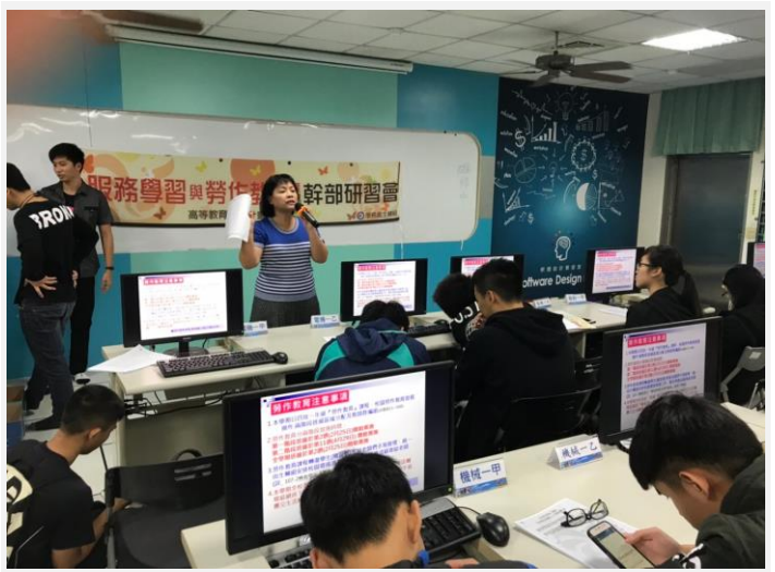
承辦人員向各幹部說明勞作教育注意事項