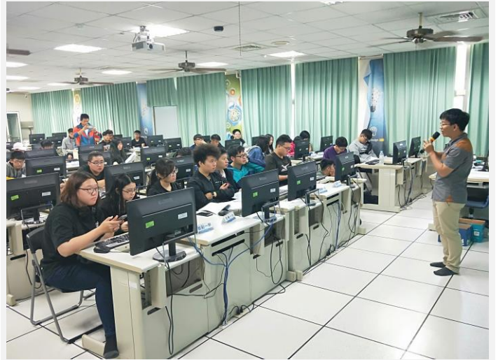
認真聆聽課程教育的學生幹部們