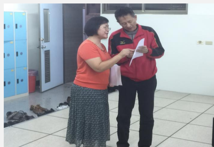
認真聆聽後，教師提問並解答