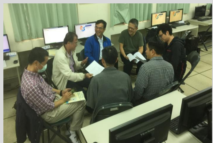
教師小組討論課程作業內容事宜(一)