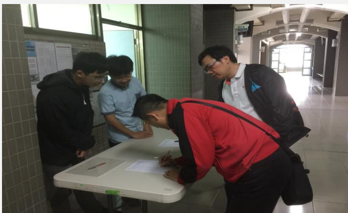
各一年級導師簽到之情形

另本校 106 學年度大一生勞作教育課程，主要讓學生瞭解勞作教育之目的，配合學習目標，於校內從事各類動手實作之活動，如教室與校園環境之清潔，及美化校園等教育與訓練學生之工作或事務，各班在本學期的打掃教室與清潔空間分配，很清楚的已經做了各項工作的分配，各班學生打掃時間的排定與規劃，執行時每日的勞作教育實施狀況，還需要老師多加幫忙與督導。