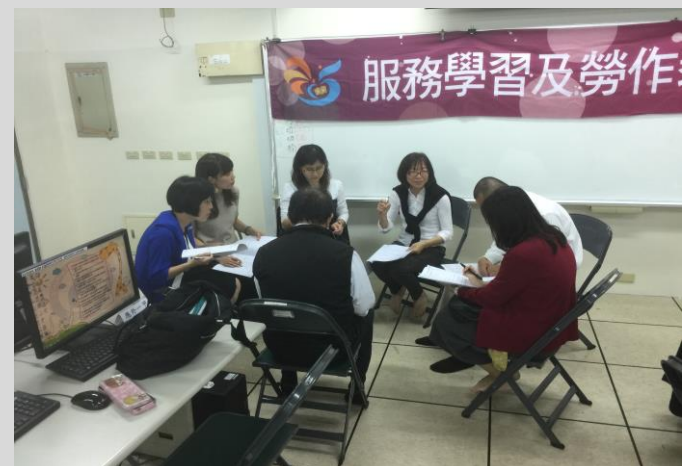
教師小組討論課程作業內容事宜(二)