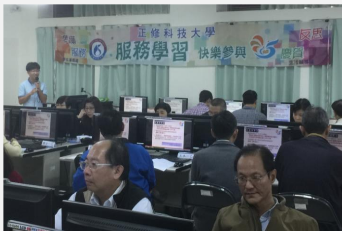
承辦人員向各教師說明服務學習注意事項