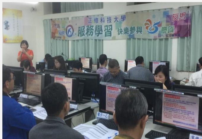
承辦人員向各教師說明勞作教育注意事項