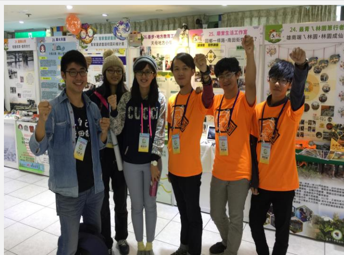
與南部社區行動夥伴合影