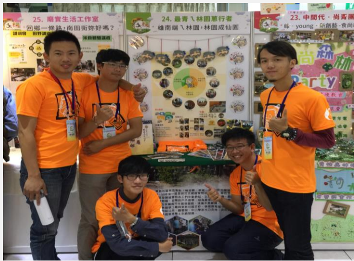
林仙園計畫展攤與參加團隊成員