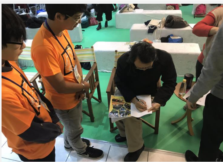
羅署長為本校青年團隊成員簽字