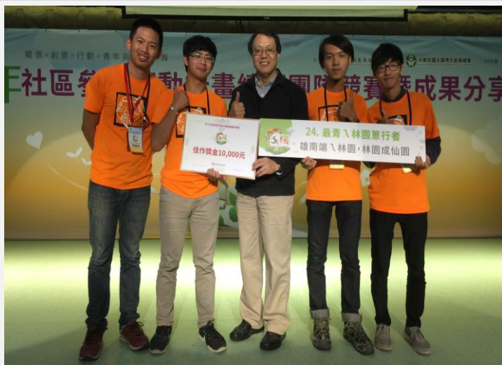
羅署長頒授本年度佳作獎予本校團隊