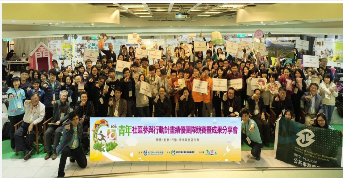
本年度計畫各組成果分享團隊與教育部長官及諮詢委員合影

秉持著自己的理念與初衷，將在我們青年身上最寶貴的 DNA 用於寶島，熱情與關懷社區的翻轉與獨特的創新，社區需要被重視，經由我們的創造基因，觸發的不同因素，增添更多獨特寶貴的事物，讓其可以成為永續發展的基石，一起為台灣不同的地域做努力，認識台灣各地的獨特風情，寫下屬於自己的回憶及故事，勇敢的去與實踐，一同加油打拚下去。